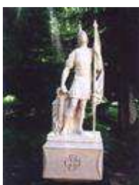
Socha sv. Floriána (ul. Hraničiarska, č.5/7)