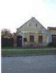
Ľudový dom (ul. Hraničiarska č. 31/57)