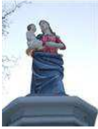
Socha Panny Márie (Dlhá ul.)