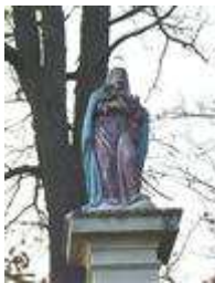
Socha Panny Márie (Cesta E 75)