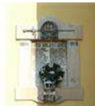
Pomník padlým v 1. sv. vojne (Hraničiarska ul., areál r. k. kostola sv. Michala )

Do tohto zoznamu boli zaradené aj nehnuteľné objekty našej MČ: