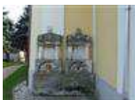
Rodinná hrobka Zsitvayovcov (Hraničiarska ul., areál r. k. kostola sv. Michala )