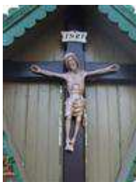
Socha Ukrižovaného ( Petržalská ul.)