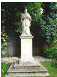
Socha sv. Jána Nepomuckého (ul. Sochorova, Na hrádzi )