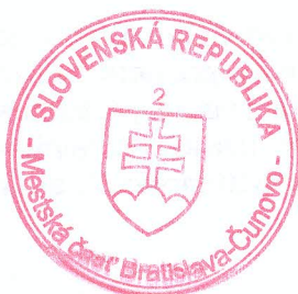
Gabriela Ferencáková starostka

Toto rozhodnutie má povahu verejnej vyhlášky a v zmysle § 26 zákona. č. 71/1967 Zb. o správnom konaní musí byť vyvesené po dobu 15 dní na úradnej tabuli a zverejnené na webovej stránke mestskej časti Bratislava-Čunovo, www.cunovo.eu . Posledný deň tejto lehoty je dňom doručenia.