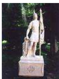
Socha sv. Floriána (ul. Hraničiarska, č.5/7)