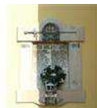
Pomník padlým v 1. sv. vojne (Hraničiarska ul., areál r. k. kostola sv. Michala )

Do tohto zoznamu boli zaradené aj nehnuteľné objekty našej MČ: