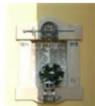
Pomník padlým v 1. sv. vojne (Hraničiarska ul., areál r. k. kostola sv. Michala )