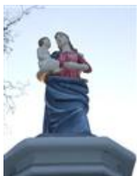
Socha Panny Márie (Dlhá ul.)