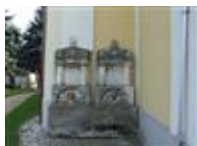
Rodinná hrobka Zsitvayovcov (Hraničiarska ul., areál r. k. kostola sv. Michala )