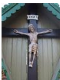
Socha Ukrižovaného ( Petržalská ul.)