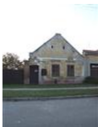
Ľudový dom (ul. Hraničiarska č. 31/57)