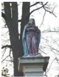
Socha Panny Márie (Cesta E 75)