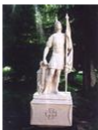
Socha sv. Floriána (ul. Hraničiarska, č.5/7)