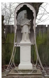
Socha sv. Jána Nepomuckého, sponzorsky obnovená v roku 2020 (ul. Sochorova, Na hrádzi )