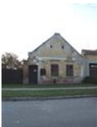
Ľudový dom (ul. Hraničiarska č. 31/57)