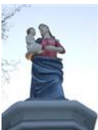
Socha Panny Márie (Dlhá ul.)