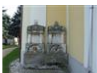
Rodinná hrobka Zsitvayovcov (Hraničiarska ul., areál r. k. kostola sv. Michala )