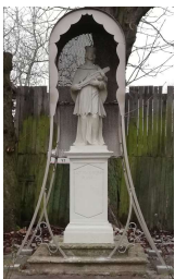
Socha sv. Jána Nepomuckého, sponzorsky obnovená v roku 2020 (ul. Sochorova, Na hrádzi )