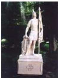
Socha sv. Floriána (ul. Hraničiarska, č.5/7)